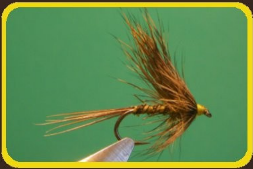
▲ Mouche de mai