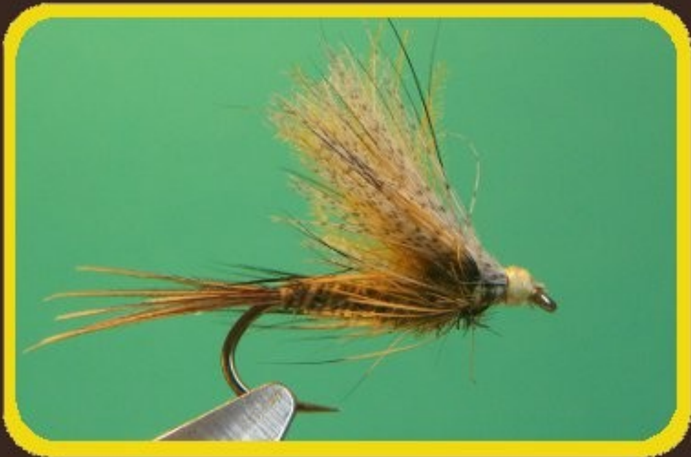
▲ Emergente de mai