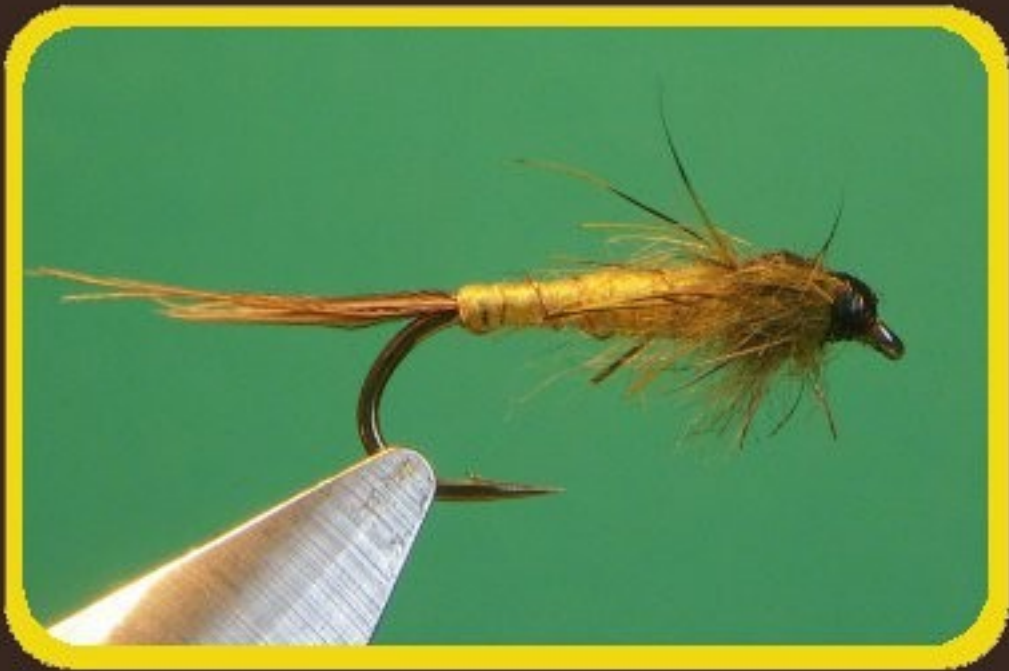
▲ Nymphe de mai