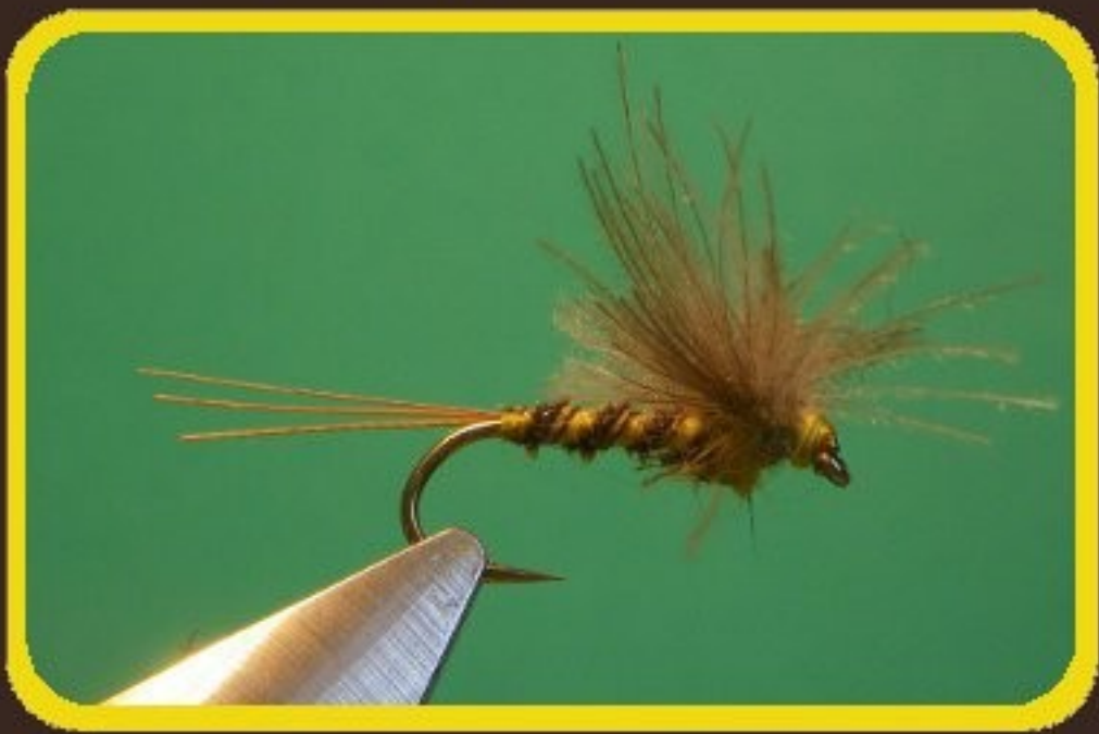
▲ Spent de mai