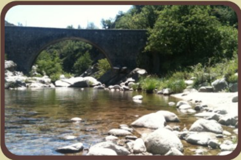
▲ Pont de la Vernède