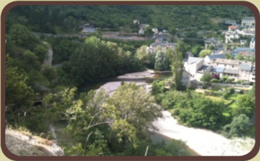
▲ Sainte Eminie